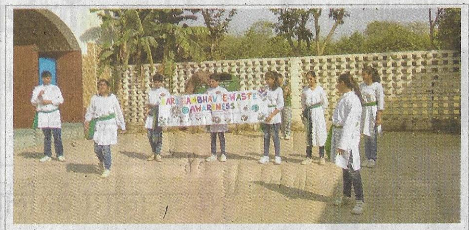
ई कचरा के निस्तारण की जानकारी के लिए नुक्कड़ नाटक करते स्कूली बच्चे।